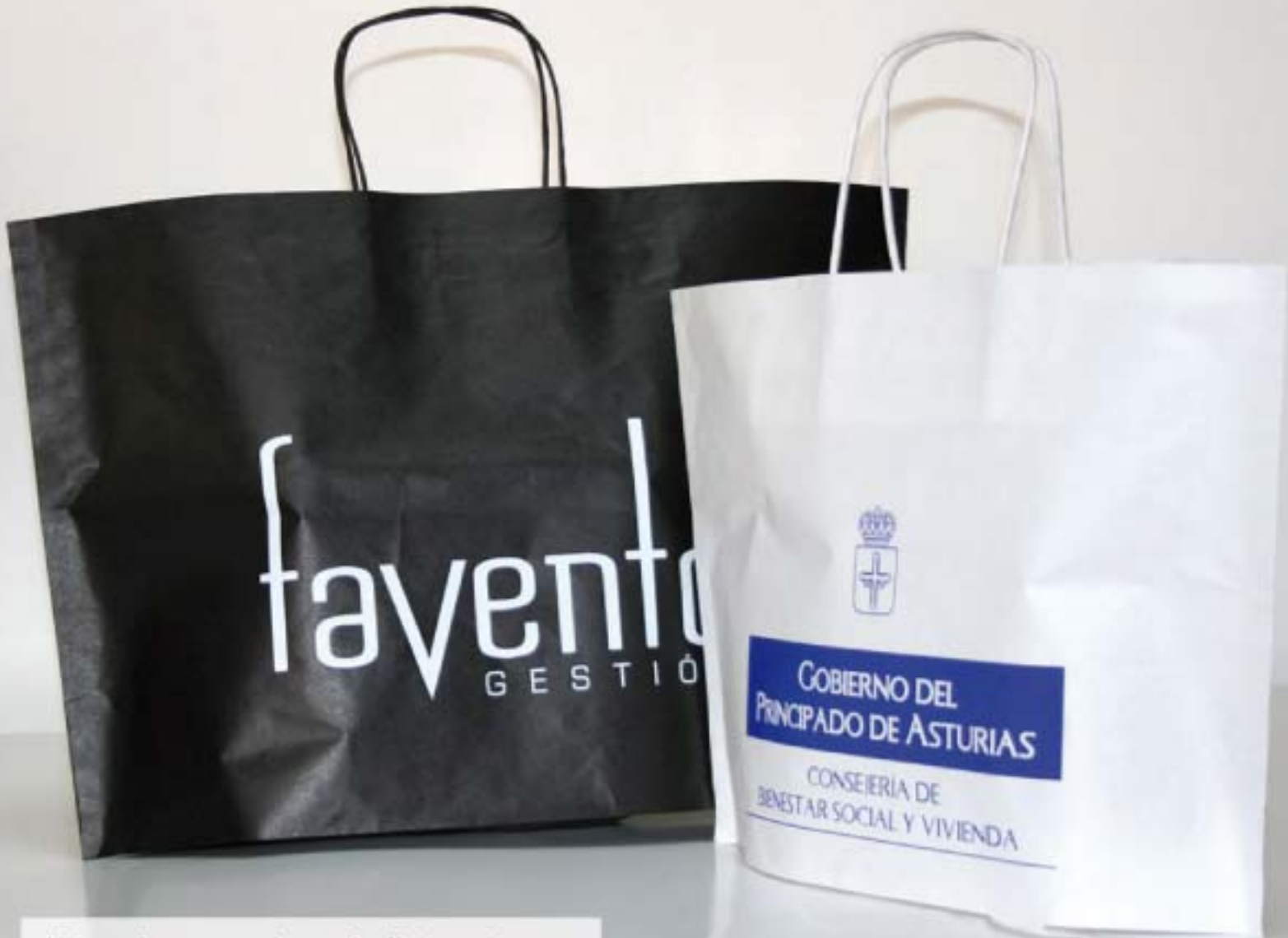
bolsas de asa rizada sin fuelle lateral y con exclusivo fuelle en la base de la bolsa