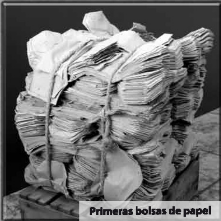
Primeras bolsas de papel