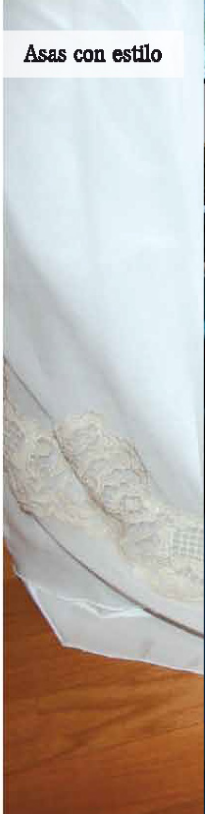
Asas con estilo