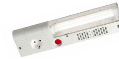
SL 025 (Interruptor On/Off)