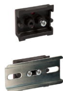
STEGOFIX SF 095

Para más información sobre los productos STEGO, visite nuestra página web: