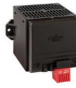
CSF 028 250 W - 400 W