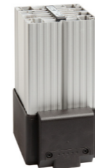
HGL 046 250 W - 400 W