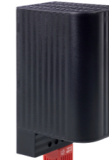
CSF 060 50 W - 150 W