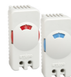
STO 011 / STS 011 (NC/NO)