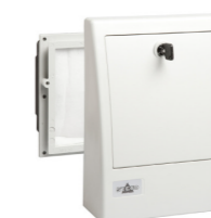
FF 018 20 m 3 /h