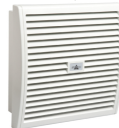
FF 018 300 m 3 /h