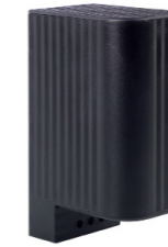
CS 060 50 W - 150 W