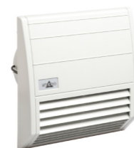
FF 018 200 m 3 /h