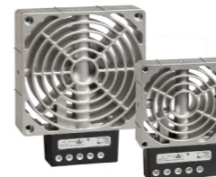
HV 031 / HVL 031 100 W - 400 W