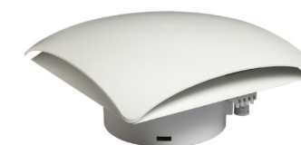
RFP 018 300 m 3 /h, 500 m 3 /h