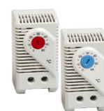
KTO 011 / KTS 011 (NC/NO)