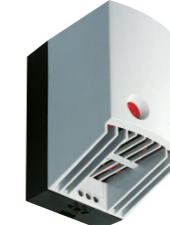
CR 027 a 650 W