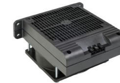
HVI 030 500 W - 700 W