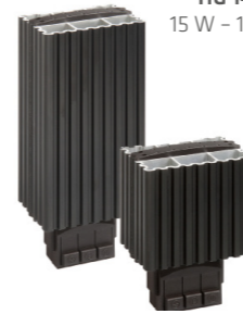
HG 140 15 W - 150 W