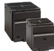
CS 028 / CSL 028 150 W - 400 W