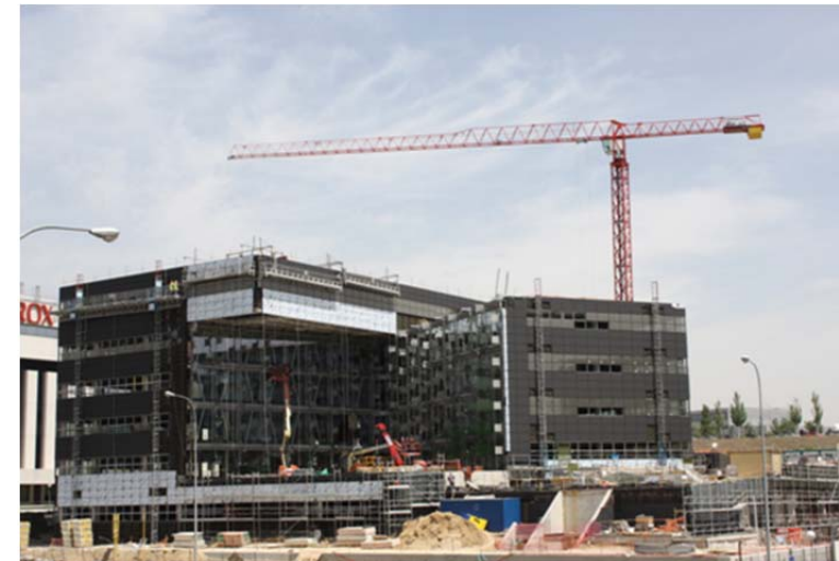
Nueva Sede de Coca Cola España – MADRID 10LC140