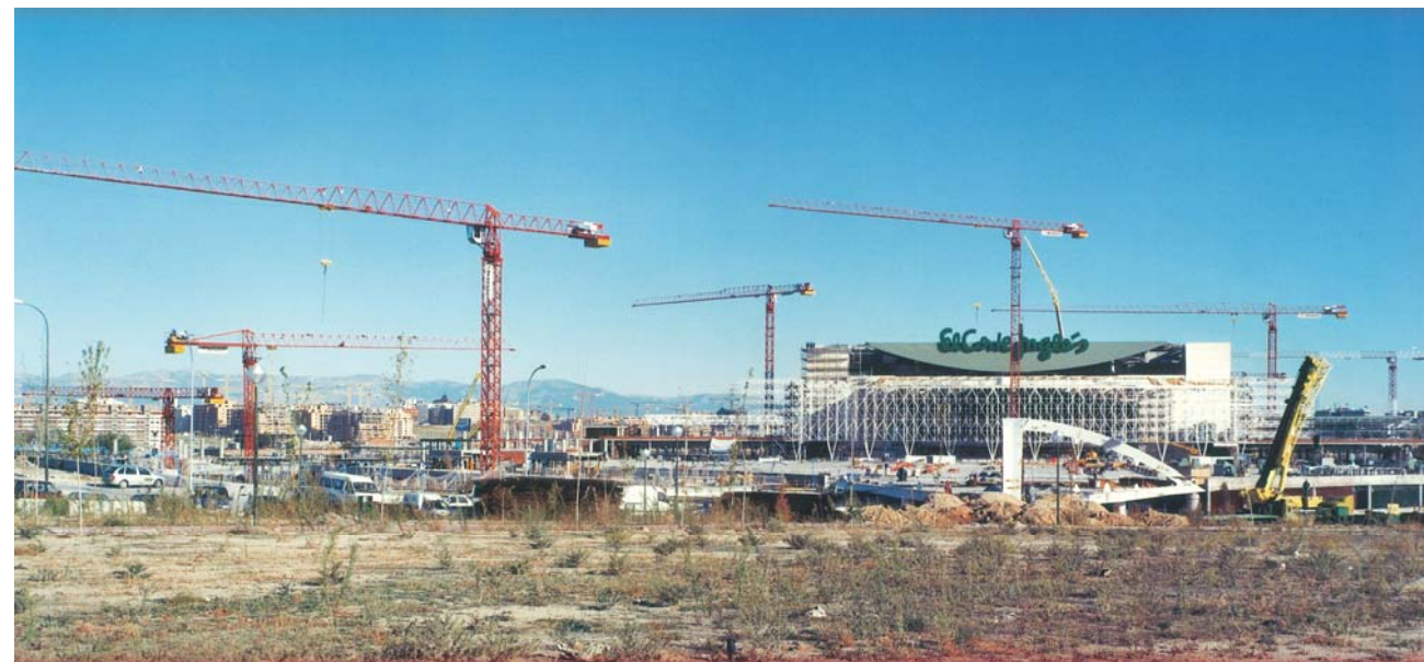
El Corte Inglés Sanchinarro – MADRID – LC1044 LC1060