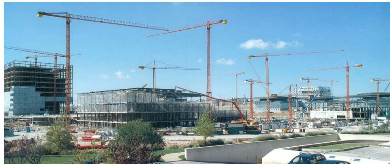
Nueva Sede de Telefónica – MADRID – LC5211 LC5013 NT45120A

En todo momento el cliente está asesorado por personal cualificado de nuestro departamento técnico y comercial; partimos de las visitas a obra y tras su estudio aportamos la mejor solución para el desarrollo de la misma. Este equipo le acompañará hasta la finalización de la obra y retirada de la máquina, poniéndose a su disposición.