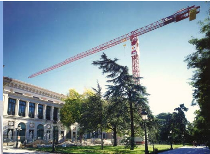
Rehabilitación del Museo del Prado - MADRID LC2074