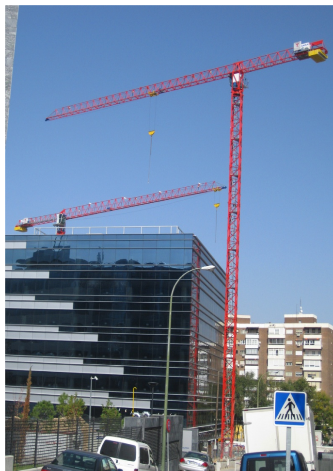
Edificio de oficinas – MADRID 10LC130 10LC140