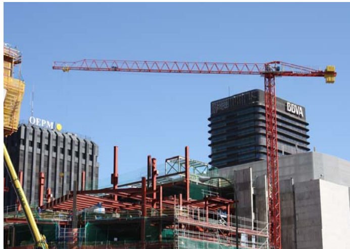
Ampliación del Corte Inglés de Castellana – MADRID 5LC5010