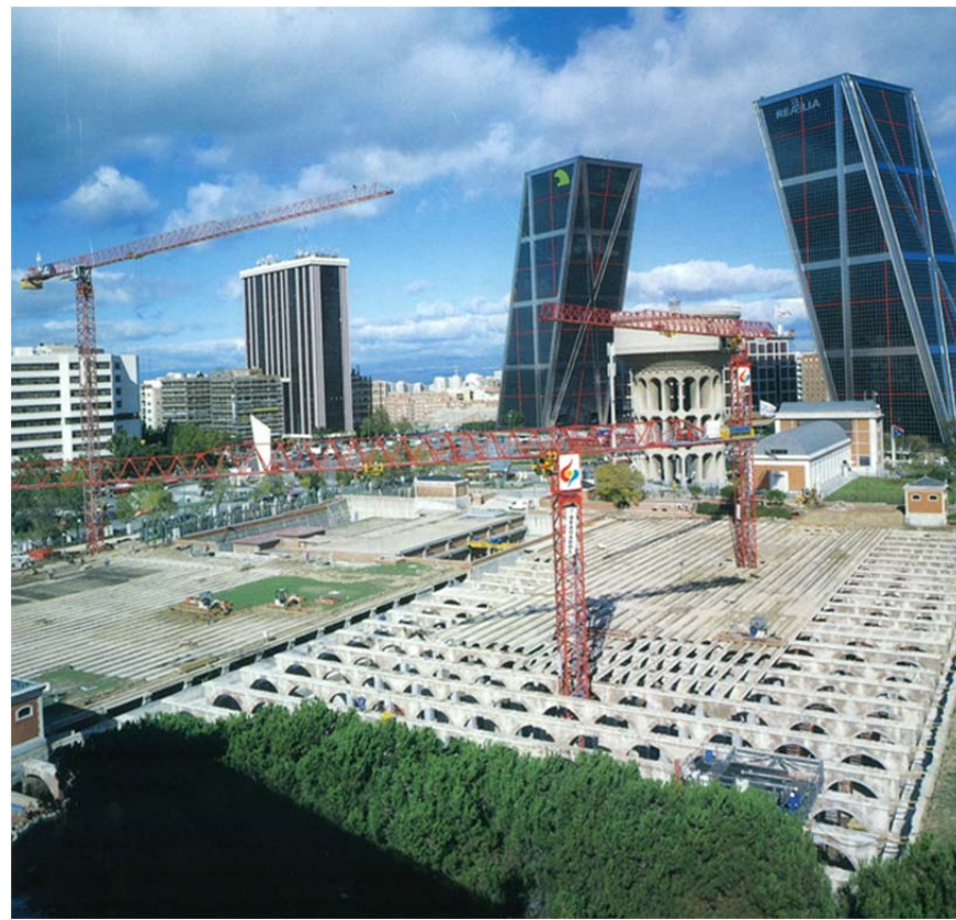
Depósitos del Canal de Isabel II MADRID LC-2074