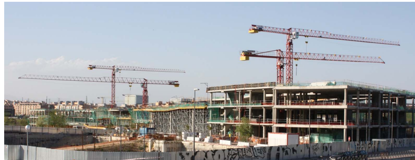
Nueva Sede del Banco BBVA – MADRID LC-5013 10LC140