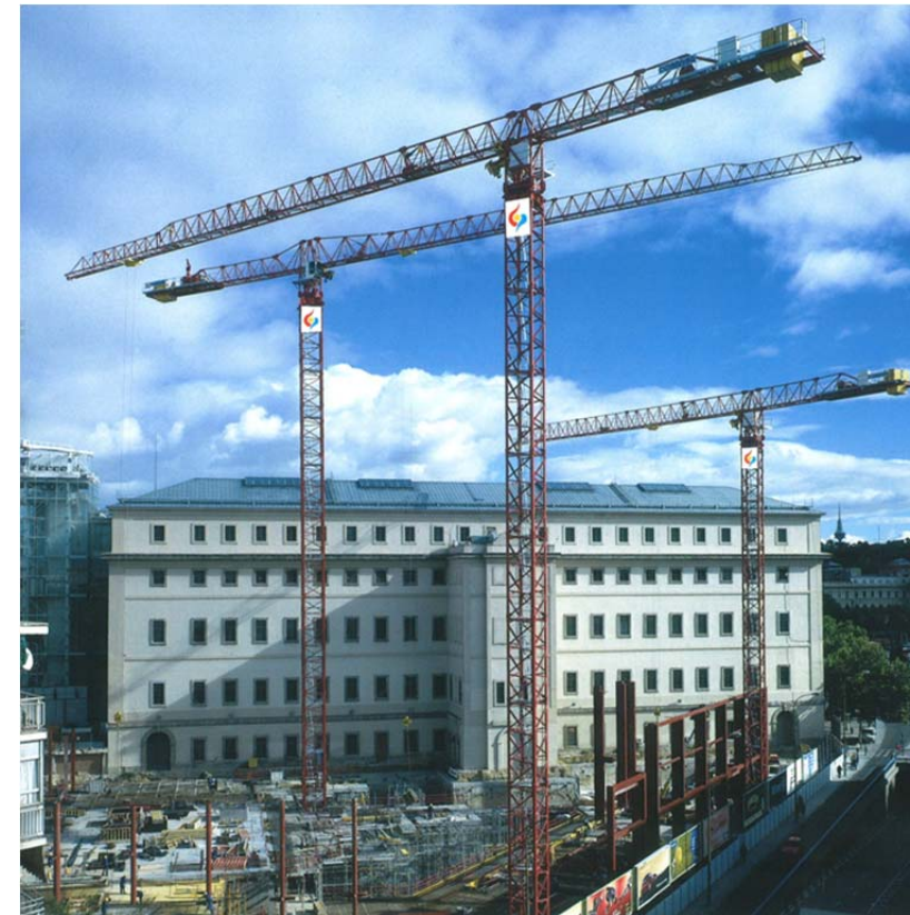
Museo Reina Sofía – MADRID – 21LC400 21LC290 21LC210

GRUYMSA es una empresa dedicada al alquiler y venta de grúas torres y automontantes desde el año 1985, ofreciendo una solución integral a las necesidades de nuestros clientes. Abarca el asesoramiento técnico para la mejor solución de la obra, la elección de los modelos y composiciones de las máquinas para su alquiler o compra, el estudio, formalización y legalización, así como el montaje, mantenimiento, desmontaje y retirada de la grúa.