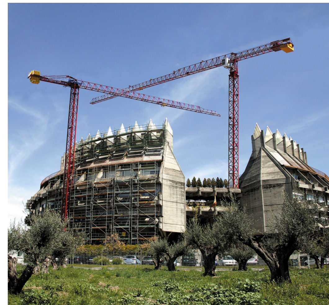
Centro de Patrimonio Histórico Nacional – MADRID 5LC5010 LC1060