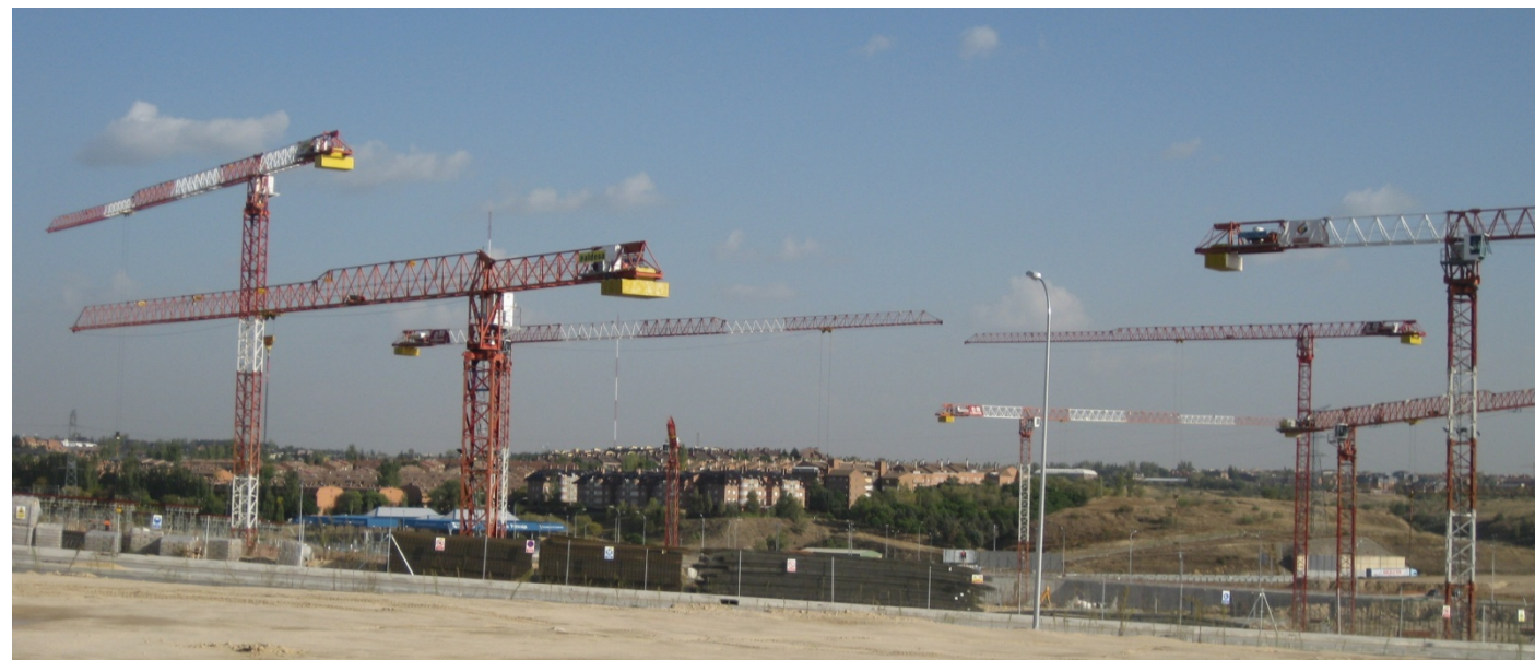
Centro Comercial Plaza 2 – MADRID – 21LC209 LC2074