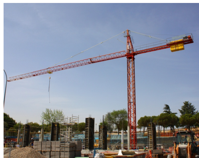
Biblioteca del Centro de Estudios ESIC – MADRID NT45120A