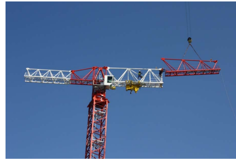
Montaje pluma 21LC550