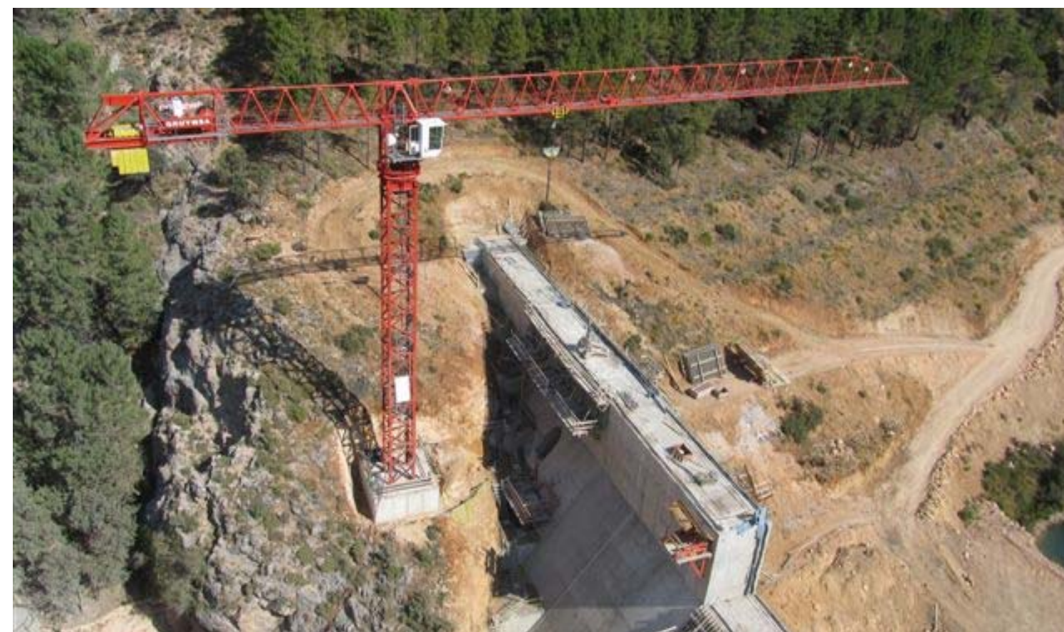
Construcción de la Presa Zapateros – ALBACETE – LC2074