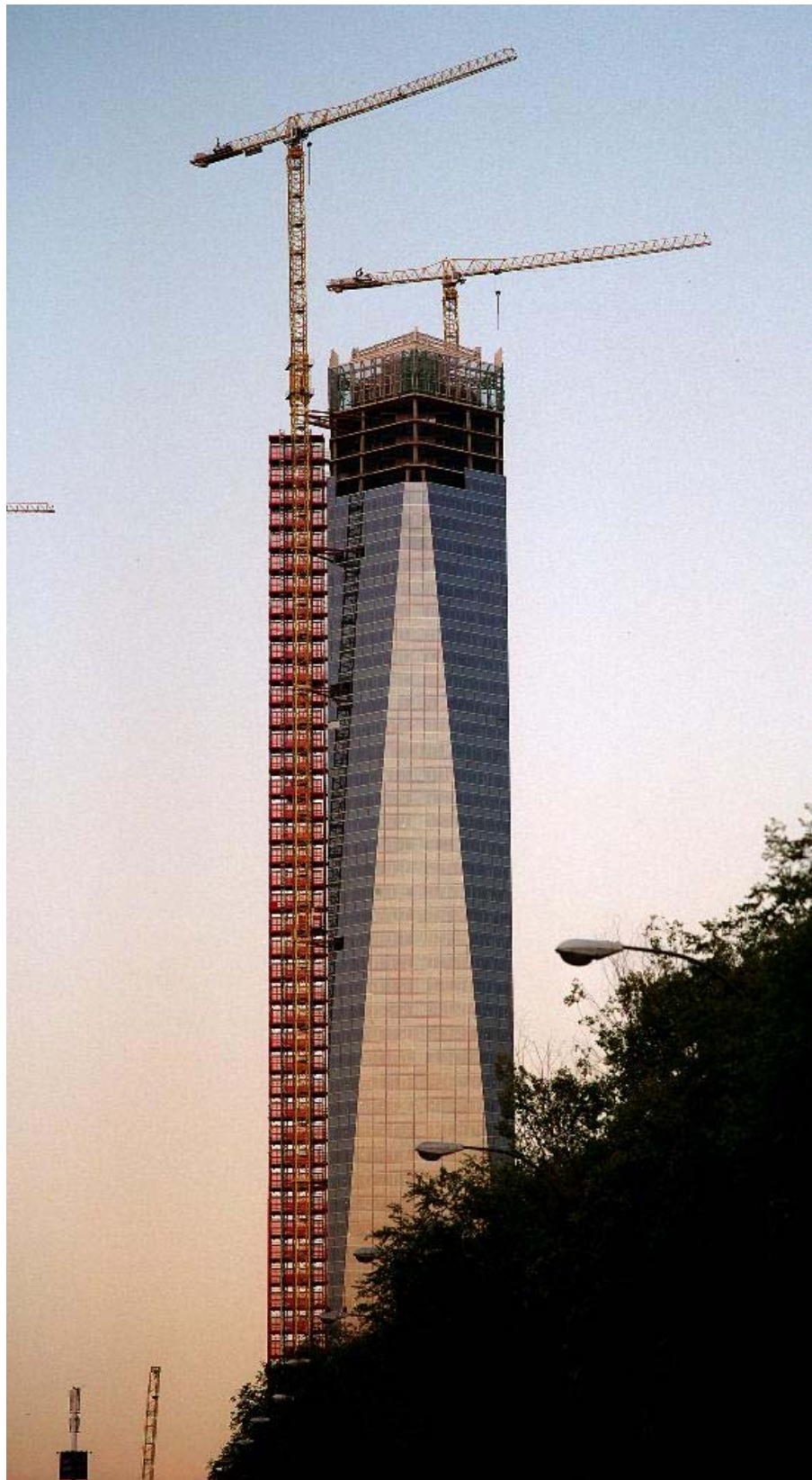
Edificio Torre de la Mutua Madrileña – MADRID – 21LC400