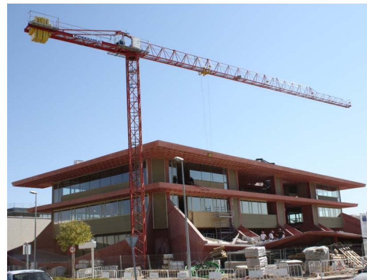
Nueva Sede Empresarial – MADRID 5LC4010