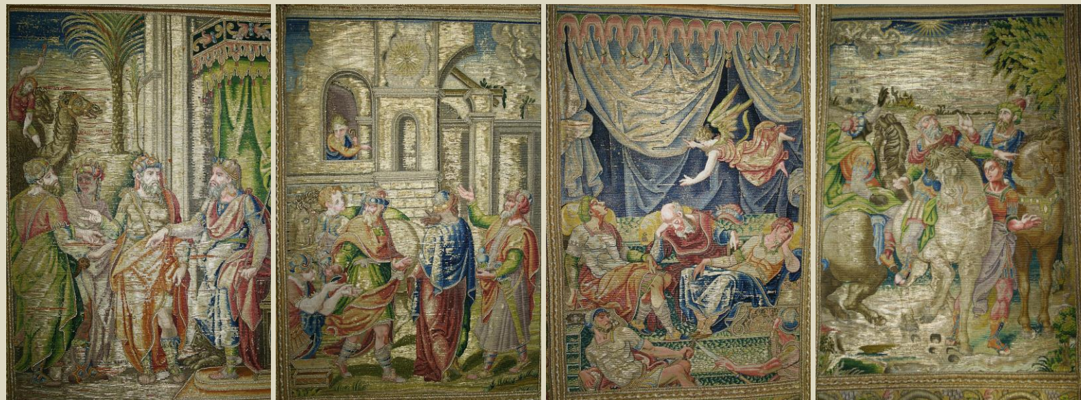
Capa pluvial "La vida de Cristo" y capillo "La adoración de los Magos" (siglo XVI) – Monasterio del Escorial, Patrimonio Nacional