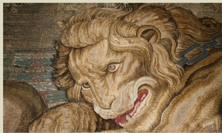
9 colgaduras bordadas de gran formato – Museo Arqueológico Nacional