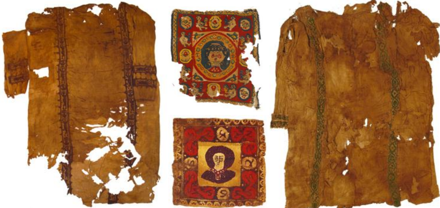
Colección de 36 tejidos coptos del Museo de Montserrat